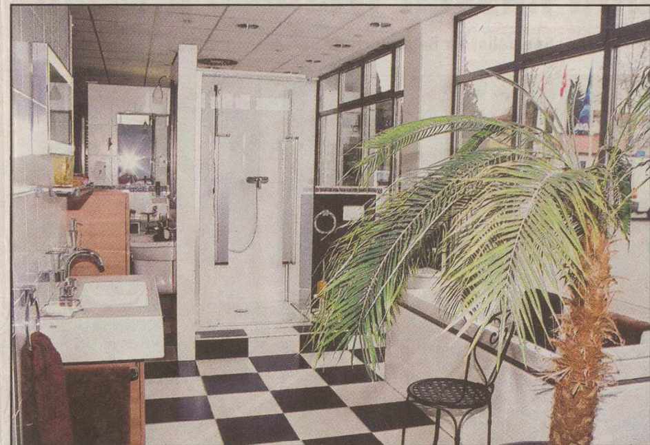
Wie wäre es beispielsweise mit einem exklusiven Bad aus dem Hause Joop? Vom Handtuch bis zur kompletten Ausstattung ist alles designmäßig aufeinander abgestimmt.

AKTION: Frühlingsinitiative der Sanitärfachhandwerker in Zusammenarbeit mit dem Hause Ufer