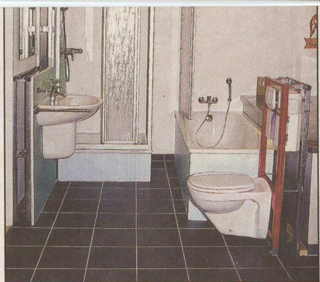
Badrenovierung ohne dass dafür Wände aufgebrochen werden müssen, um die Leitungen zu verlegen? Dank einer Vorkonstruktion ist eine komplette Neugestaltung problemlos möglich.