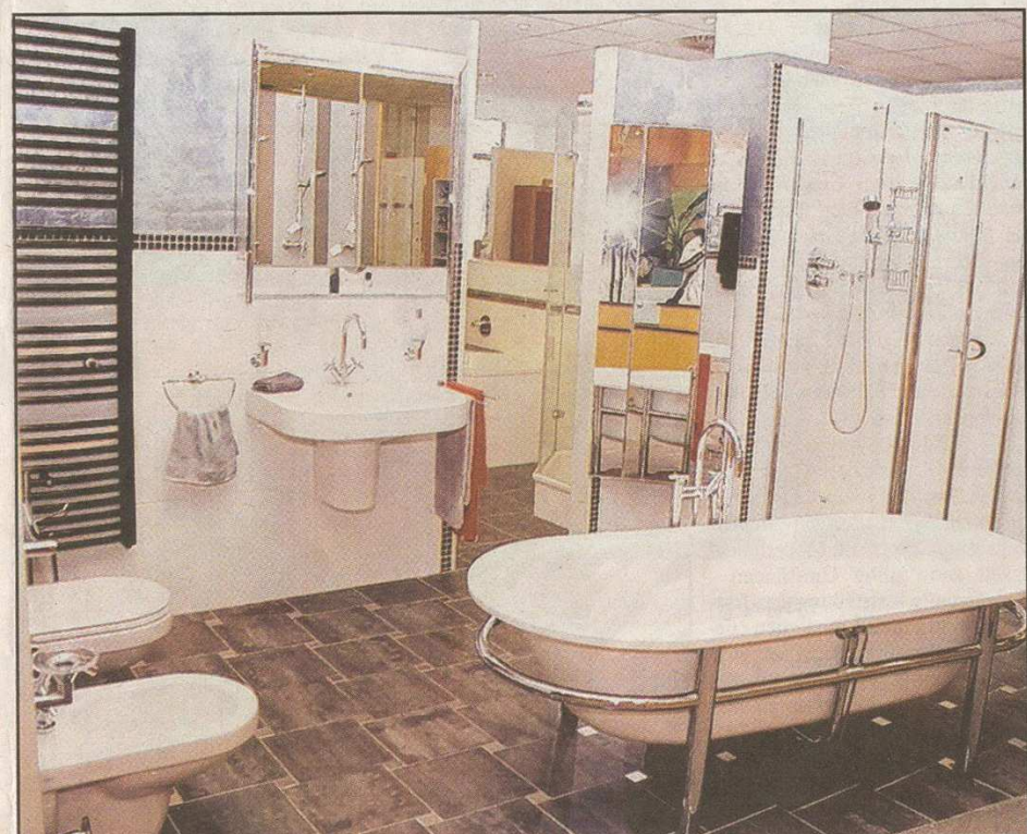
Keine Einbauwanne, sondern eine frei stehende Wanne, dies liegt ganz im Trend und zeigt neue Akzente bei der Badgestaltung.